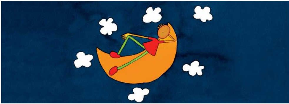
Marcador de livro | verso poderá ser na horizontal ou na vertical | imagem: Lua